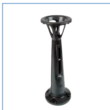
Colonnette de manoeuvre avec indicateur d'ouverture série L120