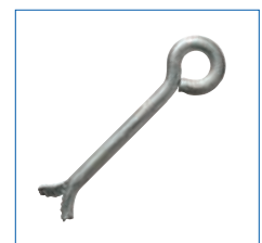
Palier guide à sceller (pour allonge à poste fixe) série L120