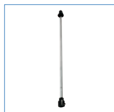
Allonge à poste fixe série B520